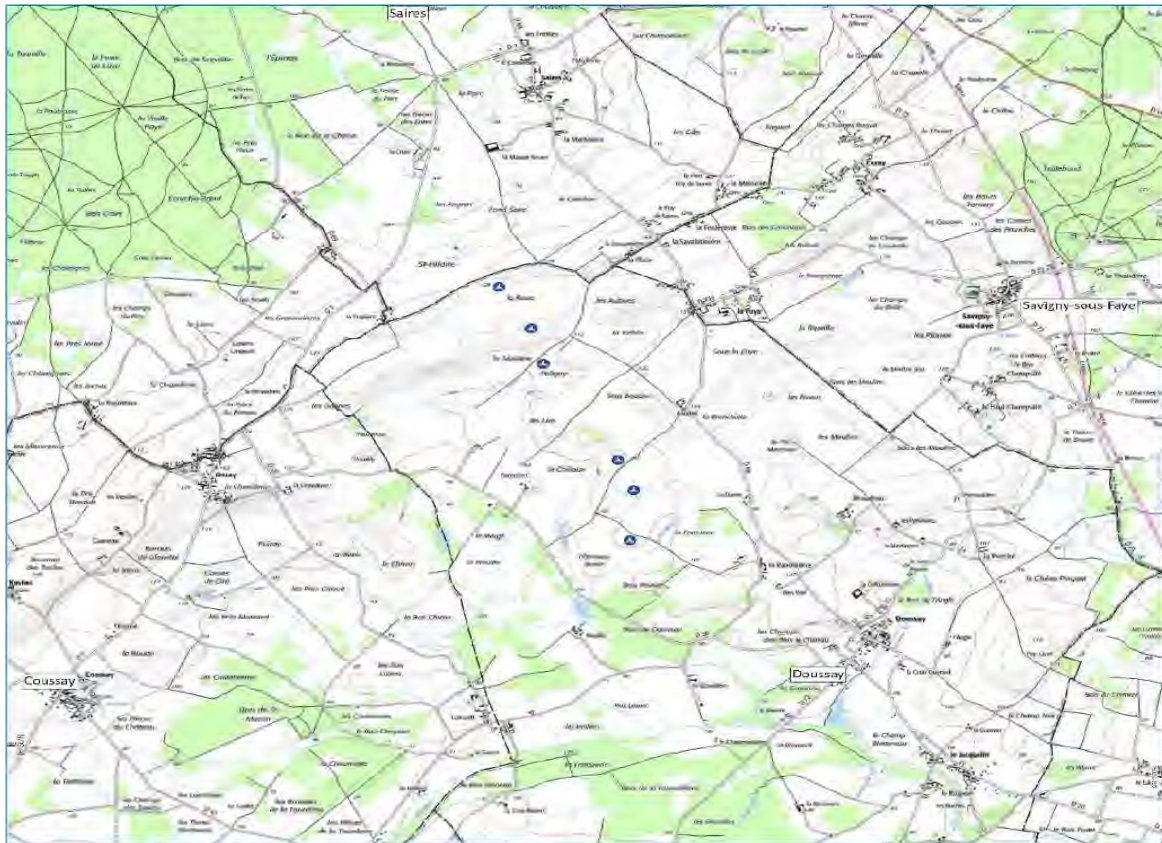
Schéma d'implantation des éoliennes