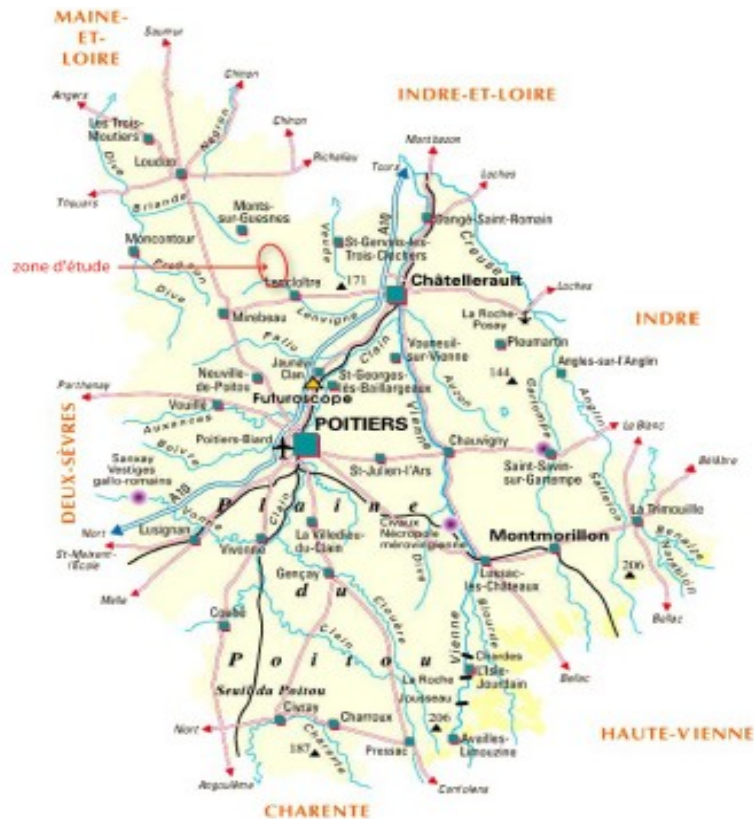
Localisation du parc à l'échelle départementale

Le projet concerne la création et l'exploitation d'un parc de six éoliennes sur la commune de Doussay, à environ 30 km au nord de Poitiers, dans le département de la Vienne. Il est porté par la société ÉNGIE Green Doussay.