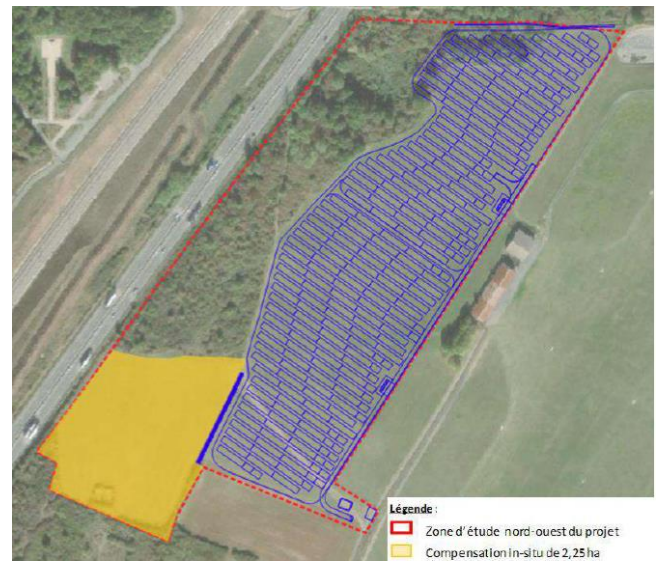
Figure 127 : Emprise de la compensation in-situ