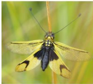
Figure 70 : Ascalaphe ambré - 29/06/21 - HR

Cette espèce est inscrite sur la liste rouge des cigales, mantes, phasme et ascalaphes en Poitou-Charentes, classée comme « vulnérable » et espèce déterminante ZNIEFF en Poitou-Charentes.