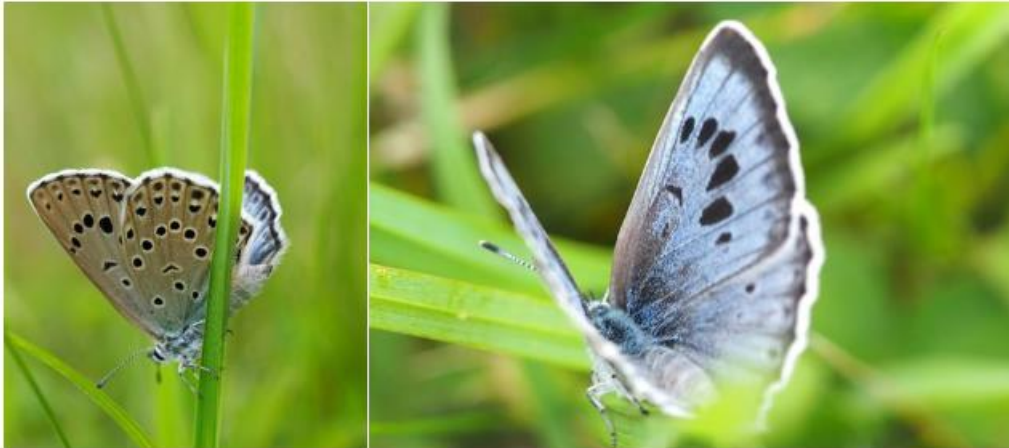
Figure 71 : Azuré du serpolet - 29/06/21 - HR

Cette observation est à joindre à ma propre observation de l'espèce (que j'avais prise en photo, in copula ) également sur la parcelle Nord-Ouest le 9 juillet 2015 :