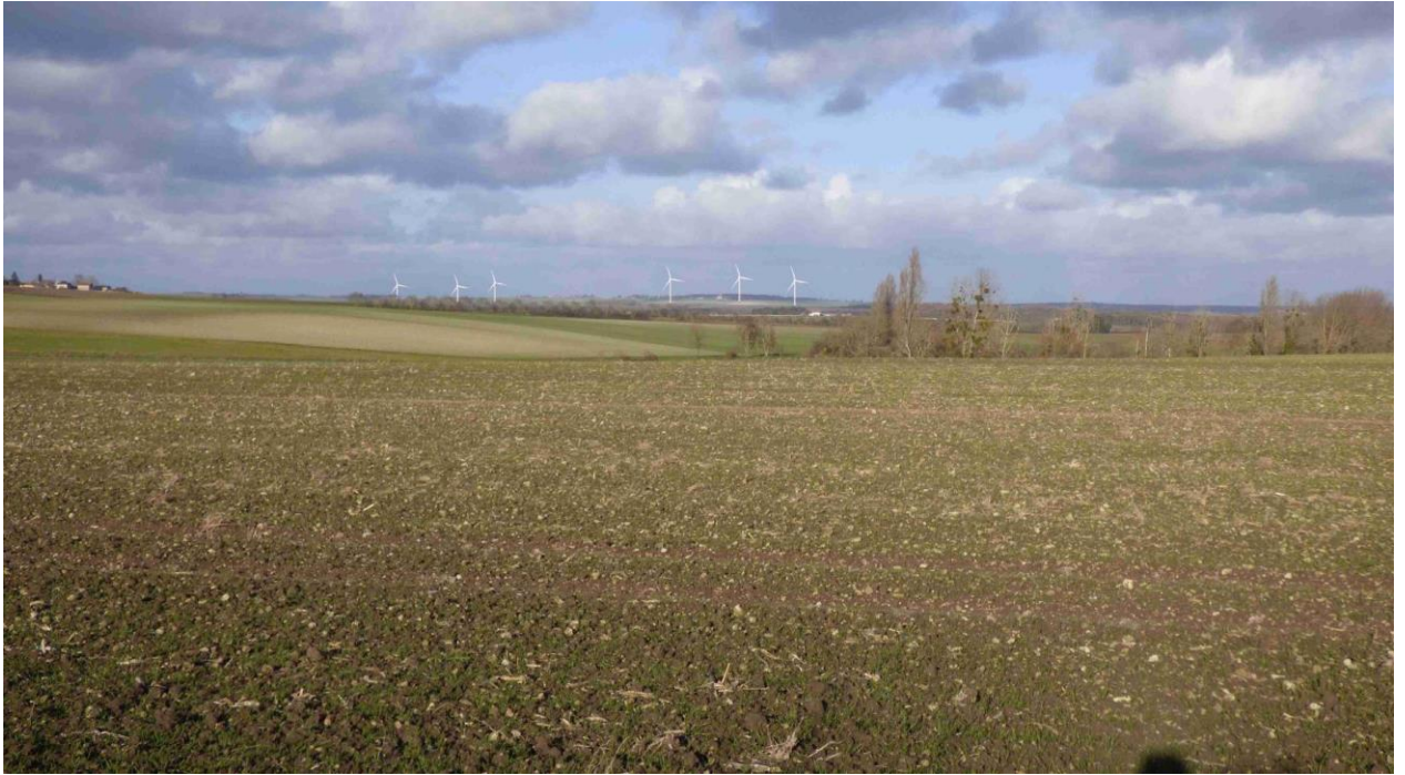
Photomontage réalisé depuis le mur d'enceinte Nord/Est du château de Rochefort

2 - Château d'Abin 86140 St Genest d'Ambière: 7 Km