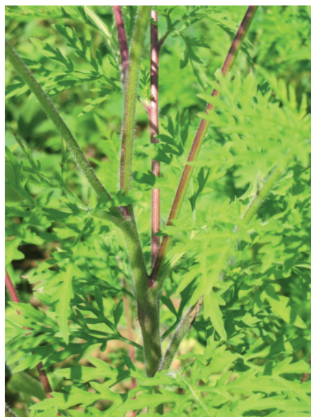
Détails de la tige rougeâtre de l'ambrosie à feuille d'armoise