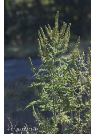
Fleur en épis de l'ambrosie à feuille d'armoise mâle

Dans le département de la Vienne, seule l'ambrosie à feuille d'armoise est présente à ce jour.