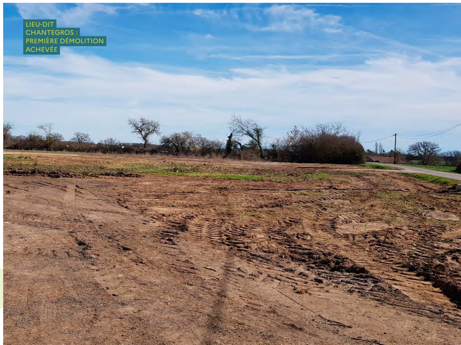
LIEU-DIT CHANTEGROS : PREMIÈRE DÉMOLITION ACHEVÉE

Conformément à l'arrêté n°2022/DDT/SEB/1996 en date du 16 décembre 2022 portant autorisation environnementale au titre de l'article L.214-3 du Code de l'environnement, une attention particulière est portée à la protection des milieux naturels et des espèces protégées.