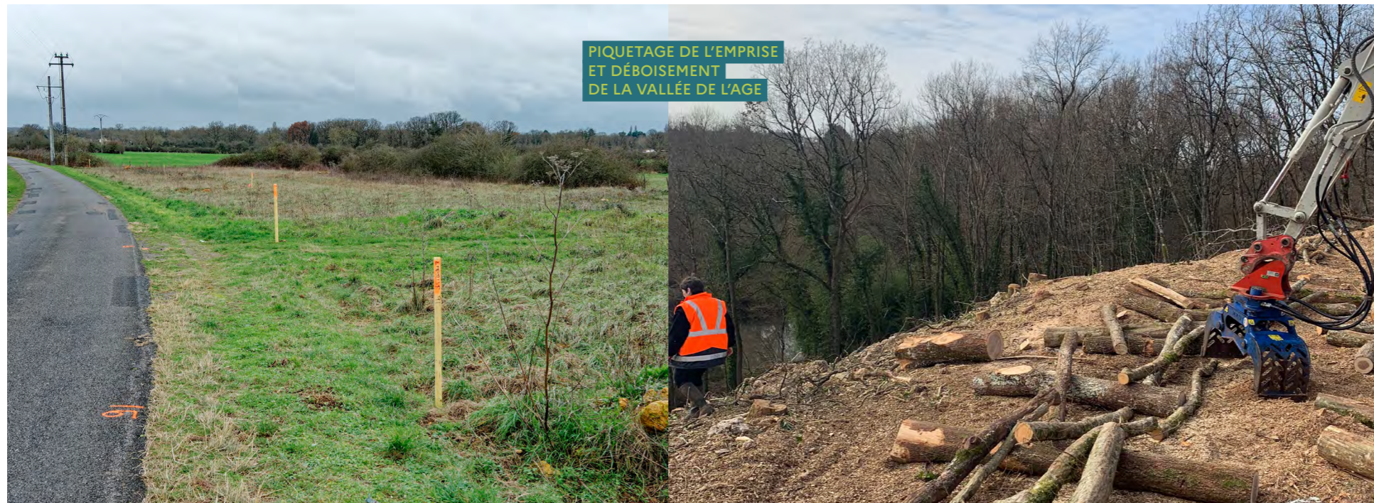
PIQUETAGE DE L'EMPRISE ET DÉBOISEMENT DE LA VALLÉE DE L'AGE